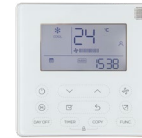
KJR-120X/TFBG-E Control de serie