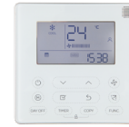
KJR-120X/TFBG-E Control de serie